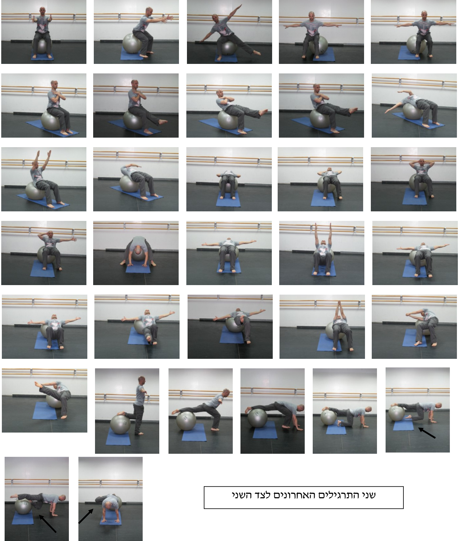
שני התרגילים האחרונים לצד השני